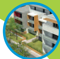
Sennecey-lès-Dijon 19 appartements automne 2019