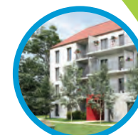
Fontaine-lès-Dijon 26 appartements printemps 2020