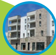
Longvic 17 logements mai 2019