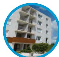
Les Ormes Arnay-le-Duc 16 logements