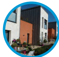
L'Eau Vive 20 logements Asnières-lès-Dijon