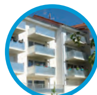
Bellevue Beaune 34 logements