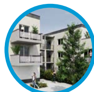
Thorey-en-Plaine 8 logements Printemps 2020