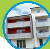
Sennecey-lès-Dijon 19 appartements