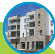
Longvic 17 logements