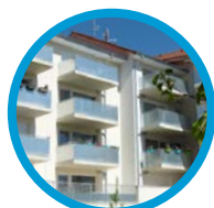
Bellevue Beaune 34 logements