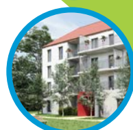
Fontaine-lès-Dijon 26 appartements Ete 2020