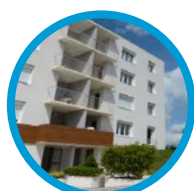
Les Ormes Arnay-le-Duc 16 logements